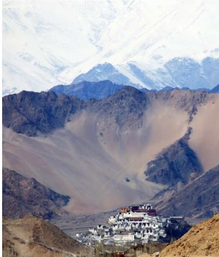
7. Monastère de Thiksey.

Monastère non loin de la capitale du Ladakh, Leh, 2017.