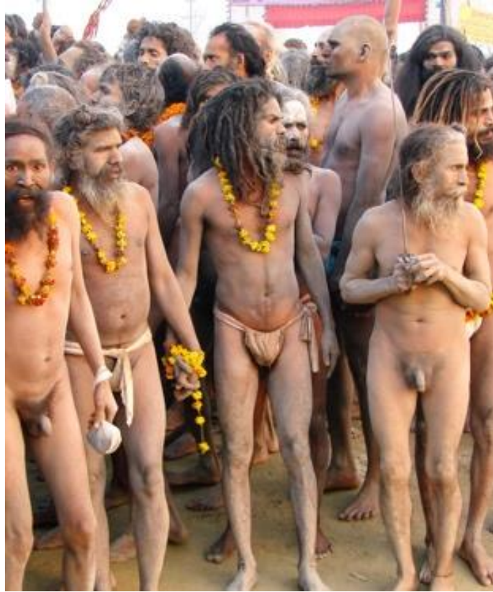
2. Naga babas (« ascètes nus »), Kumbha Mela de Haridwar, 1986.

Les Nagas babas sont les premiers à s’immerger dans les eaux du Gange auxquelles ils communiquent une partie de leurs pouvoirs. Les pèlerins s’y baignent eux-mêmes par la suite, dans un but de purification. (Photo : © Marcel Poulin).