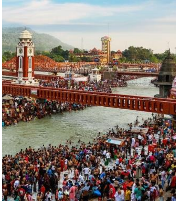
1. Haridwar, Inde du Nord, 24 février 1986.

Dix millions de fidèles se baignent dans les eaux du Gange à l'occasion du pèlerinage de la Kumbha Mela.