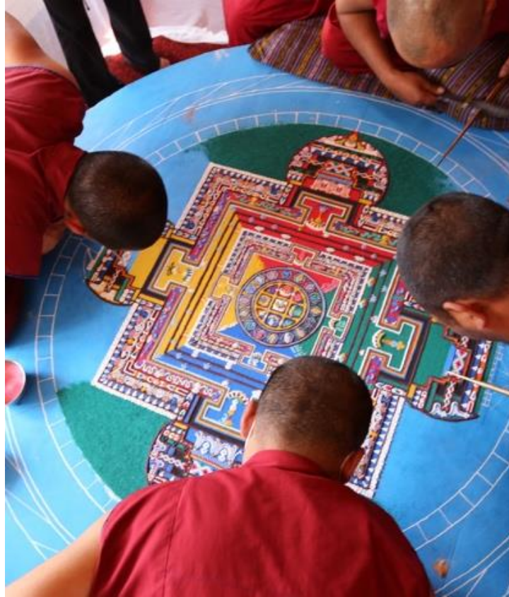
9. Moines de Saboo, Ladakh.

Moines construisant un mandala de sable, 2018.