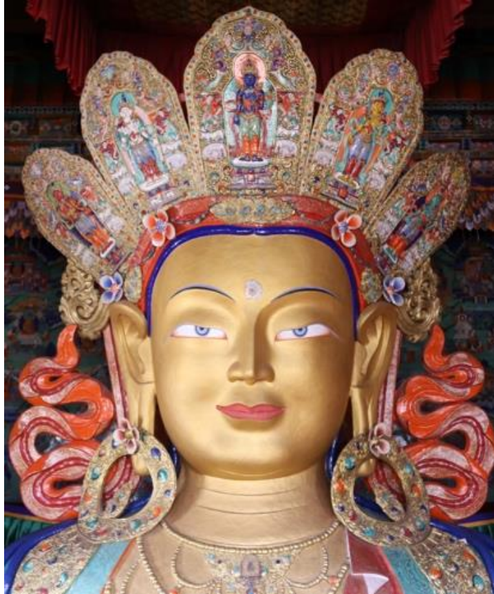
8. Statue du Bouddha Maitreya («Bouddha du Futur»).

Monastère de Thiksey, Ladakh, 2012.